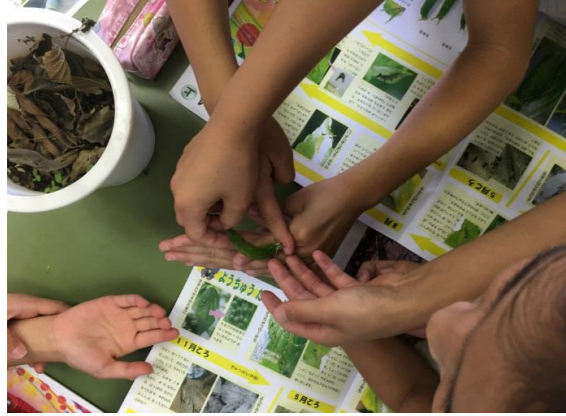
平30年 6月27日(水) エノキと幼虫をいただいて来ました。